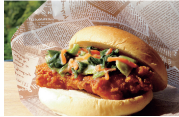
구주 파 뱃파이(초원장 무침) 치킨버거