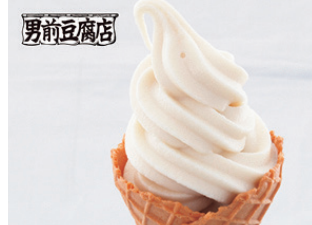
오토코마에 도후텐 두유 소프트아이스크림