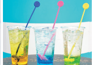
수비리어 머들러 드링크