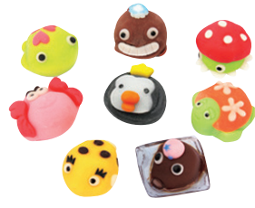
수족관 일본풍 디저트