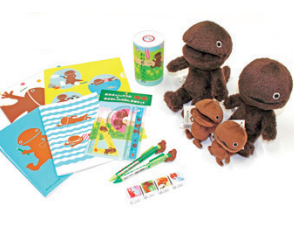
오상 쇼상 상품