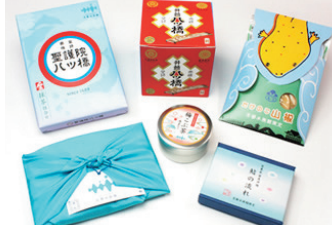
교토 브랜드와의 협업 상품