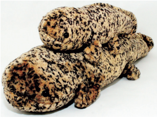
오상 쇼상 인형